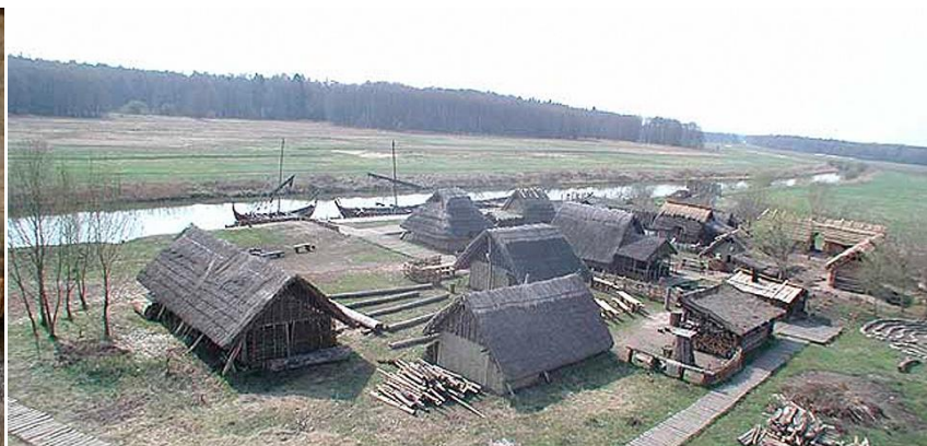
Eine Reise in die Vergangenheit – das Ukranenland