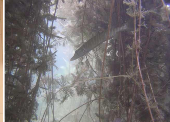
Der See in Krugsdorf